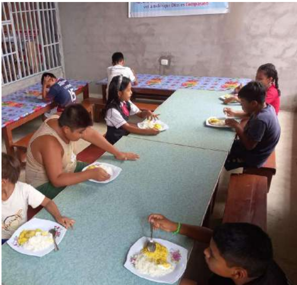
Beneficiarios del proyecto "Construcción de piscifactoría para la alimentación de los niños del hogar Nazaret"

En el 2024 somos una sólida Cáritas que promueve el desarrollo humano y la ecología integral basados en los principios de la Doctrina Social de la Iglesia.