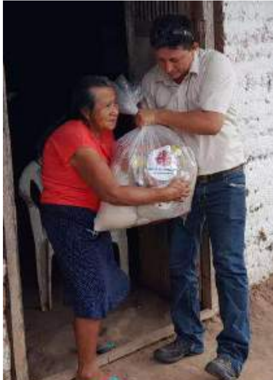
Beneficiaria de la donación de canastas y ropa.

La palabra Cáritas es un término que procede del latín Charitas (Caridad), que significa amor; en esa línea el Papa Francisco describe a Cáritas como la caricia, la ternura y la cercanía de la Madre Iglesia a sus hijos.